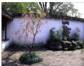
图23 海棠春坞的海棠

拙政园内有文徵明亲手所植紫藤,藤枝累挂,阳春三月,香花串串,绽放珠光宝气。“玉兰屋前种,美花香气送”的玉兰,表达主人此生当如玉兰洁的高贵品质。“若使海棠根可移,扬州芍药应羞死”,描绘了“花中神仙”海棠的风韵。海棠春坞栽植的西府、垂丝、贴梗,3株海棠造就“一枝气可压千林”,达到“姿色占春荣”的繁荣景象(见图23)。“书后欲题三百颗,洞庭须待满林霜”,创造秋季层林尽染的橘林景象。王安石《梅》“遥知不是雪,为有暗香来”,是对傲雪凌寒梅花的绝妙形容。山茶别名曼陀罗,栽植多株名贵山茶花“十八学士”,得名十八曼陀罗花馆。山茶花是多福多寿之花。枇杷为吴中地产,色黄如金。“东园载酒西园醉,摘尽枇杷一树金”。枇杷园内栽植十几株枇杷树,象征殷实富足,每一果实内含一至数颗坚核,又象征子嗣昌盛 [5] 。“风入寒松声自古”,黑松伴风摇动,松涛作响。《荀子》“松柏有本性,金石见盟心”,借黑松特性,象征主人的坚毅品格,既是自励又是标榜。“清水出芙蓉,天然去雕饰”,“出水涟漪,香远益清,不染偏奇”,“出淤泥而不染,濯清涟而不妖”,“留得残荷听雨声”。荷花是拙政园的精华,作为拙政园的主题形象,从露出圆圆的嫩叶,直到开出娇艳欲滴的花朵,都散发着诱人魅力。即使到了秋塘枯荷也依旧诗意盎然。“听雨入秋竹”,“雨打芭蕉淅沥沥”,宋杨万里《秋雨叹十解》“蕉叶半黄荷叶碧,两家秋雨一家声”,雨中芭蕉增添园林意境(见图24),突显声音之美。“竹径通幽”,“移竹当窗”,“粉墙竹影”是竹在拙政园的造景应用,因竹的高雅、纯洁、虚心、有节、不畏霜雪等特点与中国传统的审美趣味、伦理道德意识契合,被人格化,象征着虚心谦和、高风亮节、坚贞不屈的操作,其笔直凌霄的形态与人格正直在结构特征又相对应。