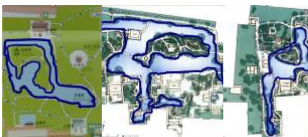
图5 东部一湾清流 图6 中部开阔水域 图7 西部层次丰富水体