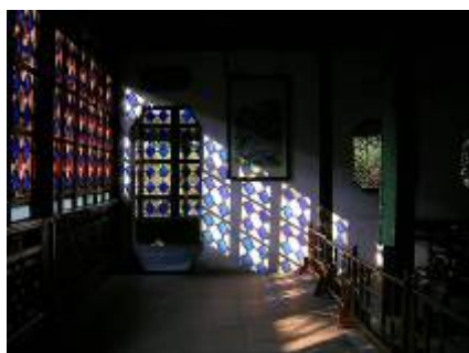
图18 卅六鸳鸯馆的法兰玻璃