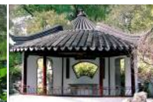
图15 扇亭、笠亭浑然一体