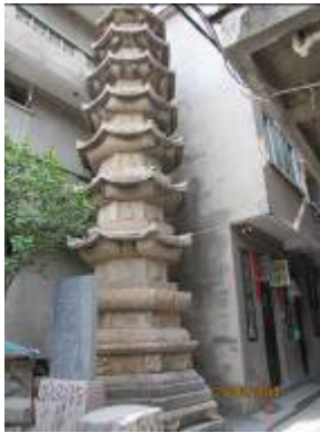
图 10 莲峰石塔

再次，除了福州地区之外，以吉祥寺塔为代表的宁德古塔还对福建沿海其他地区的楼阁式实心塔产生一定的影响。如泉州崇福寺八角七层楼阁式实心石塔的应庚塔、泉州惠安洛阳桥桥北的两座八角五层楼阁式实心石塔。