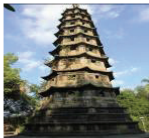
图 1 吉祥寺塔

年间曾重修, 后因雷霆震撼, 塔身欹斜, 民国 24 年福州雪峰寺主持圆瑛法师又捐募修复, 1958 年迁移到狮公山时, 重新进行了安装, 1984 年福建省政府拨款增建八角石构护栏, 目前整体建筑保存完好(图 1)。