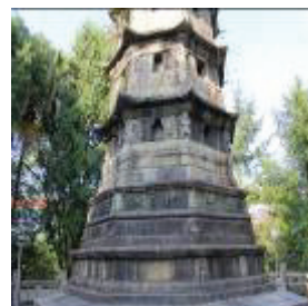
图 2 须弥座

吉祥寺塔为浑体花岗岩石砌仿木结构楼阁式实心建筑, 通高 25 米, 八角九层, 从下往上由台基、须弥座、塔身、塔檐和塔刹组成, 塔身布满浮雕, 每一层八面均设佛龛, 整体造型既醇厚古朴又端庄清秀, 在我国众多宋代古塔中独具风格, 其建筑设计、施工技术及雕刻工艺, 堪称福建楼阁式实心石塔的经典之作, 具有较高的历史研究价值与艺术价值, 1961 年被列为福建省文物保护单位。