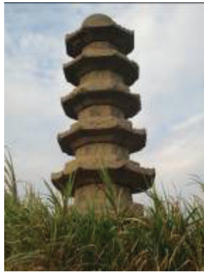
图 9 林浦石塔

其次，因宁德地区历史上曾经归属福州，所以对福州楼阁式实心塔也有影响。如位于福州鼓山涌泉寺的千佛双陶塔，也是八角九层楼阁式实心塔。其他相似的楼阁式实心石塔还有于山威公祠前的文光宝塔、尚宾路的尚宾石塔、林浦的林浦石塔（图 9）、金山寺的金山寺石塔和闽侯的莲峰石塔与青圃石塔，这些塔虽然只有七层，但其建筑样式明显参考了以吉祥寺塔为代表的宁德地区楼阁式实心石塔的造型特征（图 10）。