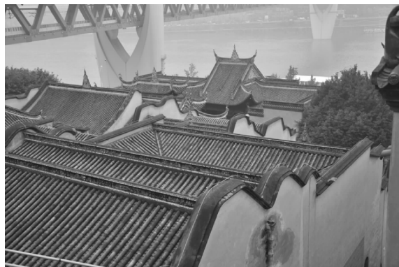
图5 重庆湖广会馆风火墙

为风火墙在隔绝火灾隐患方面具有突出功用,所以会馆在砌筑风火墙时也格外重视,其造型颇具巧思,湖广会馆的风火墙造型蜿蜒如波浪般,由高及低向江边延伸,其形态远观如若龙脊作俯冲大江之势,极具视觉冲击力(图5)。