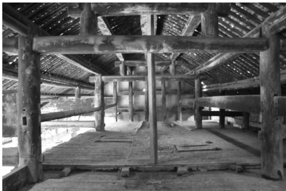
图2 重庆市彭水县靛水镇禹王宫的穿斗抬梁结构