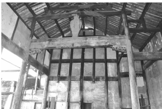
图3 重庆市巴南丰盛镇禹王宫的穿斗抬梁结构

面及翻修瓦顶等项目。古建筑瓦作分大式和小式两种作法,大式瓦作多使用石活、筒瓦和琉璃 [8]89 ,小式瓦作屋顶瓦片多用布板瓦,根据会馆建筑的用料来及工艺来看,重庆地区的会馆建筑以大式瓦作为主。