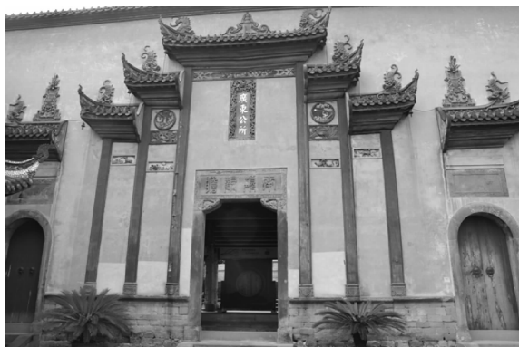
图10 广东公所山门及其所悬石匾

水路构成,商人们祈求航行顺利,贸易畅达,妈祖和禹王同为水神因而倍受推崇。2012年笔者前往江津真武场调查会馆时,在其建筑内部散落的建筑构件中依然可见“护国”“庇民”字样的条石。除了对乡情的依恋和神灵崇拜,会馆中所悬匾额楹联还有一个重要的功能,那就是对传统文化的宣扬。江西石蟆清源宫两副对联颇具代表性,内侧为“演绎往事迪思迪想/扮粉墨古寓教寓乐”,外侧对联“本是戏场若演奸诈邪淫各宜自反/岂尽假事试看忠孝节义孰非人为”(图11),其暗含忠义教化的世俗之语,正如重庆云贵公所《创修重庆云贵公所碑记》记载,“所以教一世之人,孝悌之化,亲长仁睦之道” [4]93 ,匾额和楹联正是在传统建筑中承载教化作用的重要形式。