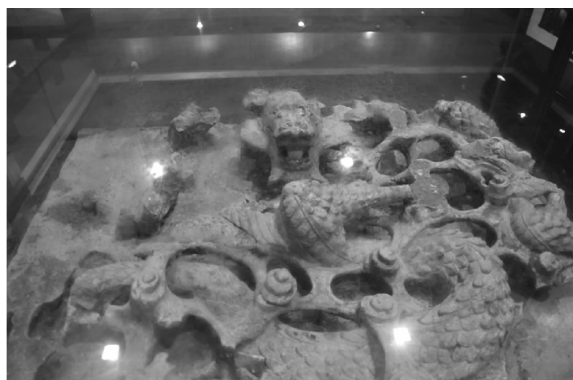
图9 重庆湖广会馆出土盘龙石雕