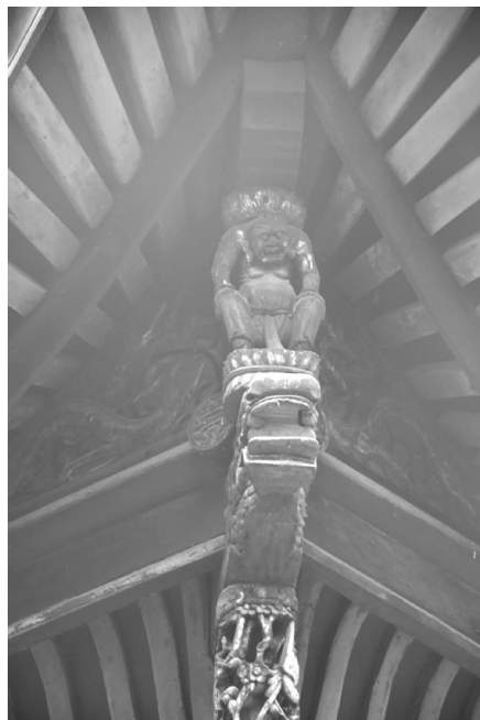
图7 广东公所建筑木雕装饰构件