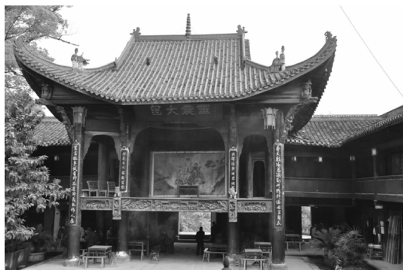
图11 江津石蟆镇清源宫其楹联刊刻于戏台立柱之上