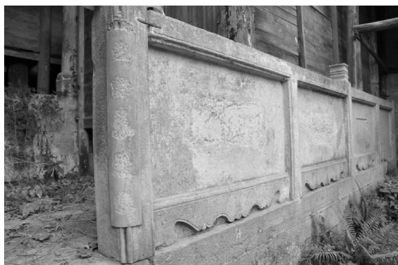
图8 重庆市彭水县靛水镇禹王宫石栏杆

建筑中裸露在外的部分多选取石雕装饰。在重庆地区的会馆建筑中,石雕不是最主要的建筑艺术表现形式,但是在建筑整体艺术的打造上,其质朴的风格衬托出木雕的灵巧以及彩绘的精美之感。齐安公所的石雕集中体现在石朝门以及看台前的石栏杆、柱础石等建筑构件上,戏台前的石质栏板历经百余年的时间均有不同程度的风化,栏杆上的石狮、石象轮廓虽已漫漶不清却自有朴拙的意味,其合适的结构比例使石质栏杆看上去并无笨重之感,反而与建筑派生出一股浑然之气。彭水靛水镇的禹王宫也装饰有石质栏板,并在其上刊刻有对联和图案,可惜的是文字及图案已被铲掉,无法辨识(图8)。湖广会馆建筑群在修复过程中,从齐安公所抱厅出土了一座石质透雕盘龙,该盘龙石雕采用镂雕技法,但奇特之处在于龙身透雕鏤状纹路,并且鏤状接头之处的铁钉都清晰可见(图9)。巴县档案记载重庆江南会馆正殿外亦雕有“二尺盘龙石”。坐落于贵州镇远镇的天后宫,其正殿前的石梯上也装饰有盘龙石雕,盘龙雕饰或为这一时期会馆建筑的流行装饰图样。