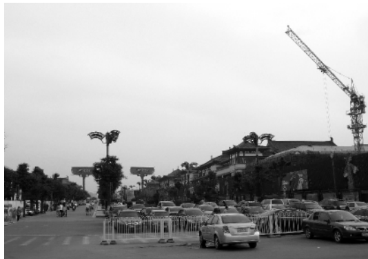
图3 西安大雁塔商业仿古一条街

城市进程中的物质建设是对传统文化又一次灾难性毁灭,沿袭着传统脉络的历史街区逐渐消亡,极具地域特色的历史街区被成片的破坏。而遍地装饰性景观填塞于城市之中,许多地方大造仿古一条街,仿不同时期的建筑风格,肤浅的运用地域文化符号,更甚者运用欧式的风格来装点“门面”,这些是景观设计中造假式的“城市美化设计”,是一种扭曲的文化活动现象,是违背自然属性的伪文化建设,只顾眼前利益的短期行为表现。(图3)