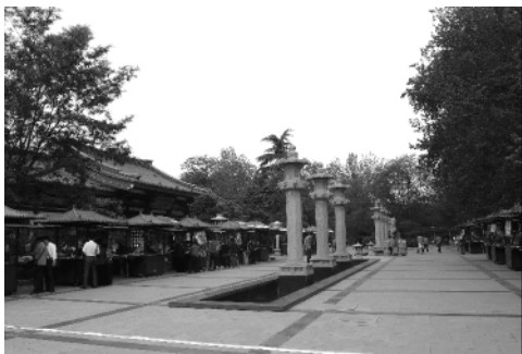
图2 西安大雁塔水景装饰小品

“面子工程”、“形象工程”,披着地域文化的外衣,做表面的文章,具体表现在:(1)大量附着于景观墙面、地面的装饰性浮雕设计;(2)图腾装饰柱在景观环境中的泛滥;(3)多余的公共艺术品、装饰小品出现在景观环境之中。(图2)