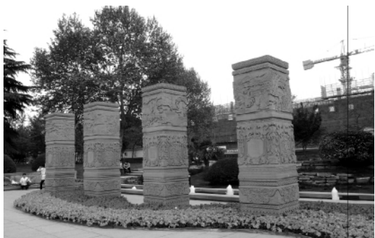
图4 广场入口图腾柱

装饰是人们在劳动过程中对自然规律性的形式要求和主体感受,它将人的观念和幻想外化和凝冻在这些物质对象上,是物态化活动的产物,是历史的积淀,反映着一定历史时期不同地域意识形态特征。一定的形式反射着一定时期的生活或生产内容,但对于现在来说,装饰仅仅只是传达视觉的符号,成了纯粹的装饰。(图4)