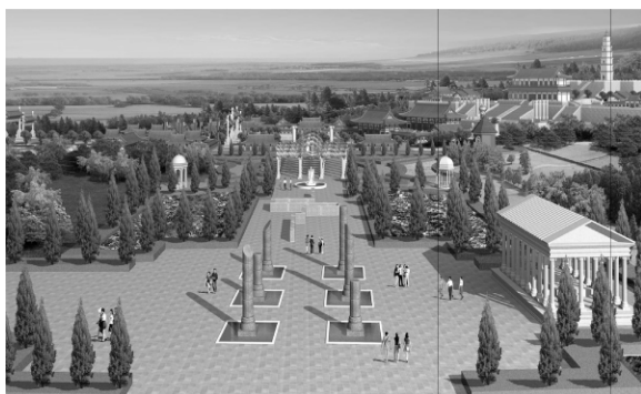
图4 西方轴线效果图

(3)西方景观文化轴线分析。以西方园林景观设计形式为依据,以几何的形式划分区域;以基督教文化仪式包括:洗礼、坚振礼、圣餐礼、忏悔礼、婚礼这几个形式贯穿始终(图4)。