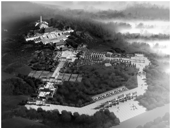
图 6 整体鸟瞰图

(5)三条轴线的交汇点分析。在三条轴线的交汇点是以丝绸之路为主题内容的广场设计,意在反映由于丝绸之路的开通,使中西文化得以交流、互融,“景教”正是中西文化交流的历史见证(图 6)。