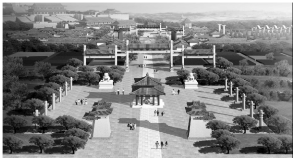
图 5 东方轴线效果图

(5)三条轴线的交汇点分析。在三条轴线的交汇点是以丝绸之路为主题内容的广场设计,意在反映由于丝绸之路的开通,使中西文化得以交流、互融,“景教”正是中西文化交流的历史见证(图 6)。