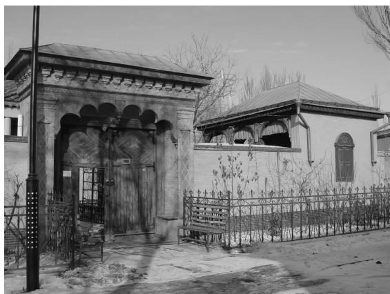
图7 六星街特色民居建筑