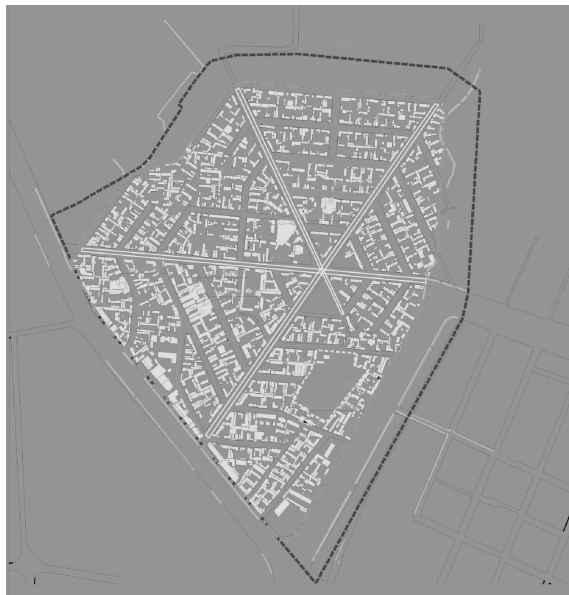
图 2 六星街平面格局

而去,渐渐模糊。由聚到散,如水波般层层晕开,这种独特的视觉图景享受也是六星街街区的魅力所在。