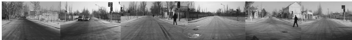
图 3 街区中心环路周边街景

(3)六星街是伊宁市一道独特的风景,是“田园城市”理念的一个缩影、一种直观的展示,也是热闹喧哗的城市中一处宁静的田园风光。这让人们真实地感受到了“田园城市”理念的魅力。建筑沿着放射性的街道,在环形扩散模式下依次