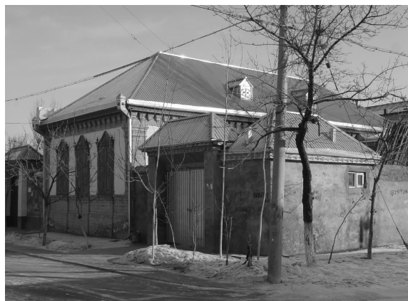
图6 六星街特色民居建筑

(4) 对于有着鲜明特色的民居需要重点保护。从这些民居的形态,不难发现环境、气候、文化等因素对于建筑风格形成的影响。图6是典型的俄罗斯风格民居,屋顶与窗户都是俄式风格的。图7则是维吾尔族风格与俄罗斯风格相结