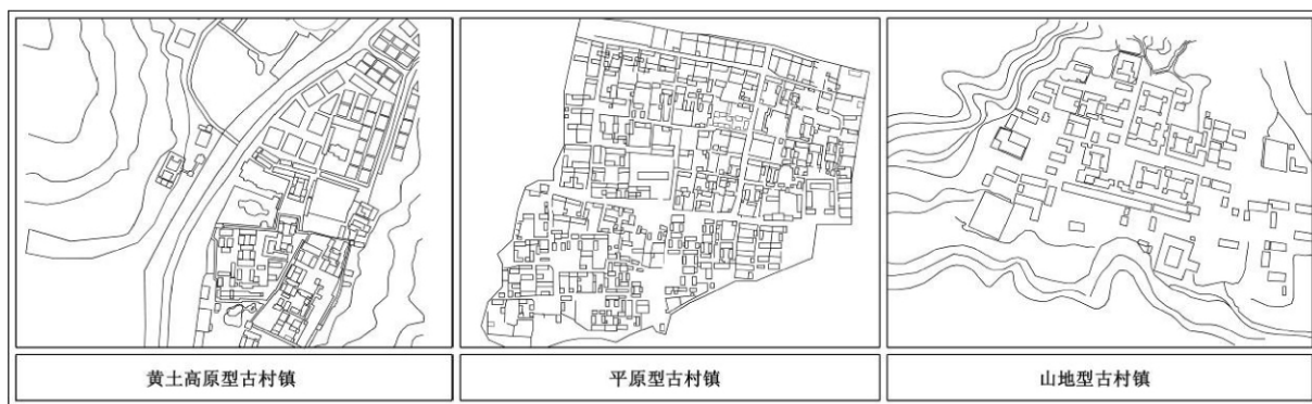
图 1 历史文化村镇地形地貌示意图

山西省地形地貌较为复杂,根据历史文化村镇的分布,结合山西省的地理概况,从地形地貌的角度,将山西历史文化村镇划分为三类(如图 1):①黄土高原型历史文化村镇。以山西西北部地区分布在黄河流域为代表,这类历史文化村镇都是地处黄土高原地区,整个村落的布局 and 建筑形式都具有明显的黄土高原特征,整体;