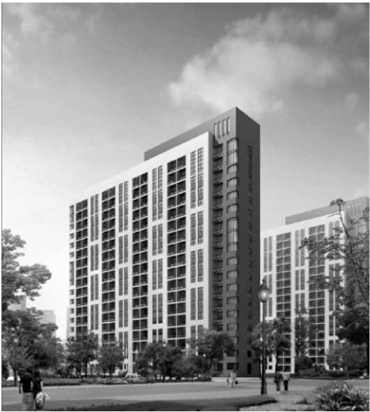
图 6 建筑效果

景观绿化系统以创造“多层次、多结构的交往空间”为理念,设计中考虑到南北地块的整体性与延续性,北地块设置滨水公共中心绿化休闲广场与南地块社区文化休闲绿地相对接,创造了一个通透的视廊和丰富的休闲空间,廉租房内各组团设置了组团绿地,丰富中低收入居民的交往需求。滨水部分设计了自由的步行开敞空间,并将邻里中心的水面打开,将水引入社区,不仅改善了社区的微气候,也创造了趣味的景观场所(图 7)。