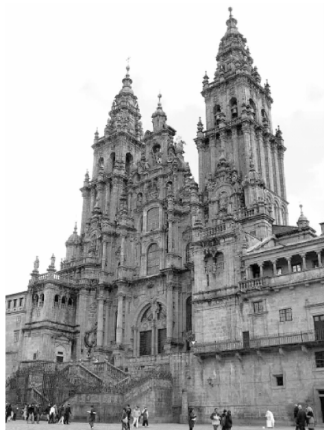
图2 西班牙“科瑞古拉风格”的圣迭戈德孔波斯特拉大教堂(1040—1109年)