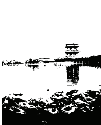
图2 大唐芙蓉园望春阁远景