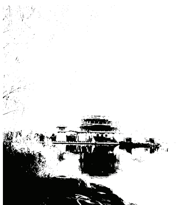
图1 大唐芙蓉园紫云楼