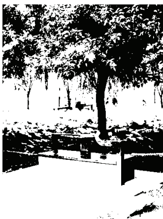
图5 大唐芙蓉园内的休息座椅