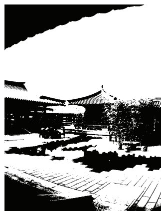
图3 大唐芙蓉园陆羽茶社