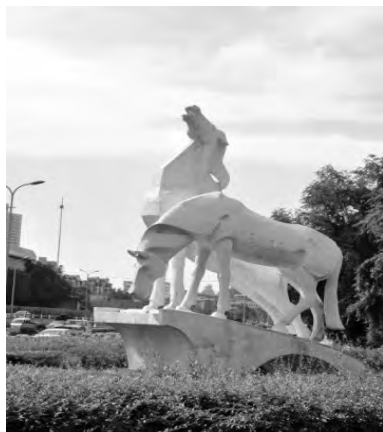
图2 “长桥饮马”城市雕塑