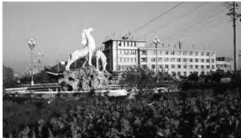
图5 1985年“长桥饮马”

雕塑迁移前,位于十字路口的观赏性花坛中心,由于是城市的繁华地段,与之交汇的光明路,新民西街,友好南路,新华北路都是观赏雕塑的极佳位置,人和雕塑的互动非常频繁,是慢速步行系统中重要的节点(图5)。然而现状不容乐观,现在的位置属于快速交通的一部分,孤立为匝道中的一块封闭绿地,完全没有步行系统的设置,南侧的道路边只有一个城市开放空间的辅助性次要出入口,经调查此处的人流量几乎为零(图6)。通过笔者的实地体验,近距离与雕塑互动俨然成为了一种危险的行为,此处的车流量非常大。中距离观赏也因为缺少便捷通达的驻足地点而失去可能性。只有远距离站在西大桥北侧的人行通道上才能观赏到雕塑,然而由于距离较远,与雕塑发生互动的几率大大降低了,视觉效果也不是最好的。