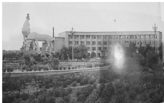
图3 1980年的“长桥饮马” [5]

(2)据在青山苑晨练的包汝诚老人说:“1986年的中秋,我特意来‘长桥饮马’拍照,照片的前景位置还有街心花园,花园正中是两匹马的雕塑,一匹仰天长啸,一匹低头饮水。当年我每天上下班都要骑车经过这里,后来随着街心花园的改造,雕塑挪到了河滩路上,虽然现在雕塑摆放的位置不起眼,也不能像以前一样带着孩子在‘白马’旁边玩耍了(图3),可是我晨练的时候还是喜欢来到西大桥上看一看它,习惯了,如果哪天见不到它真觉着生活里缺了点什么”。