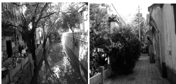
图2 朱紫坊水巷风情

这种虚实相生,主次分明的街巷空间结构经河坊公共空间过渡到巷弄半公共空间,再过度到宅邸半私密、私密空间,引导人们经历了一个完整的序列空间,将居民的休闲、交往、交通等功能有机结合起来,而且内外交织的活动也活跃了街巷的气氛,营造了一份画意浓浓的空间意象(图2)。