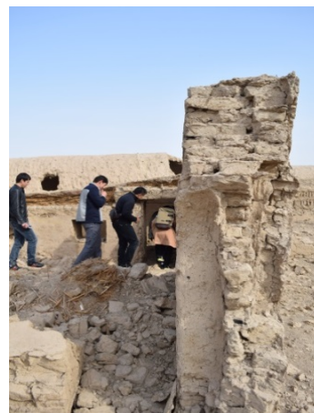
图8 被弃置的生土建筑