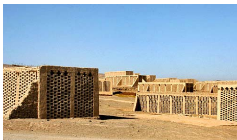
图5 葡萄晾房群落

吐鲁番地区的建筑类型主要以传统民居和生产用房及清真寺居多。大多数原住家庭都会以种植葡萄的收入作为经济来源,因此晾房类建筑与当地人的生产、生活息息相关。晾房有的是群体建造(图5),形成一个整体的葡萄干生产片区;有的则与民居相结合(图6),形成一个宽敞高大的室内空间,在葡萄晾晒季节作为生产用房使用,其他的时间则作为活动空间或储藏空间使用。