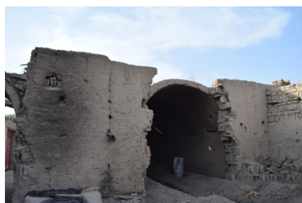
图7 生土结构受风蚀作用破落

与砖混和石混结构的建筑相比,生土结构的葡萄晾房长期保存难度很大,因为生土结构的建筑极易受到风蚀而过早破落(图7),另外新疆地区处于多震地带,生土建筑的结构安全性得不到保障。在对吐鲁番的考察中发现,很多生土建筑坍塌损坏后就直接被弃置一边,而不做任何修缮、围护、拆除等后续工作(图8) [4] 。如今,吐鲁番人民清楚地认识到了生土建筑存在坍塌的隐患,该地区晾房建筑正在由生土结构向砖木结构、砖混结构过渡,这种变化无疑将引起葡萄晾房风格的改变,其建筑特色与建筑风格也将随之消失。