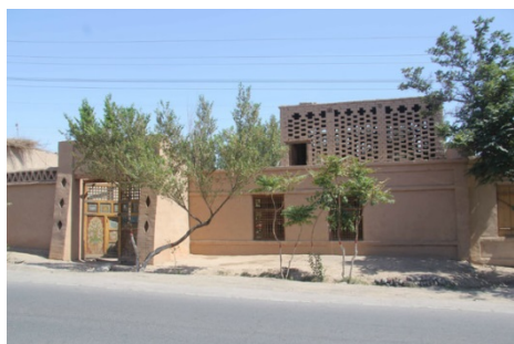
图6 民居结合葡萄晾房