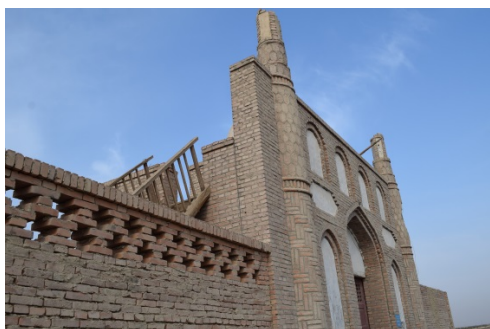
图4 清真寺外围墙上的十字形孔洞