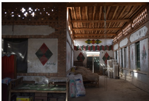
图3 晾房式样的镂空片墙