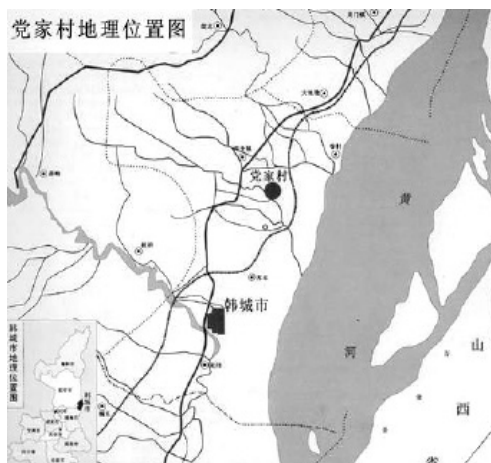
图1 党家村区位示意

由于抓住时机、经营得当,从最初的日用杂货贸易逐渐过渡到商品贸易,经过十几代近百年的管理经营,成为当地巨商。由此,党家村的经济形态发生了转变,由单纯的农业经济转变为以商业为主兼营农业的经济形态。从公元1796年至公元1861年近百年的时间里,是党家村商业经营的鼎盛时期,同时也是党家村翻旧盖新,持续百年的建设时期。整体村落格局、主要建筑四合院以及配套建筑祠堂、寺庙、文星阁、护家楼、节孝碑等都是在此期间形成的。公元1851年到公元1853年,社会动荡,盗贼猖獗,从村民的安全以及防止外贼的侵扰的角度考虑,利用村东塬地势较高之地建造了“泌阳堡”,堡中修建了几十座四合院。