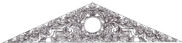
图3 日本公使馆本馆三角山花砖雕大样 [2]15

中国传统建筑装饰图案一般采用自然界、神话故事、人物传记、历史记录、吉祥图案等作为装饰题材。从屋顶的各种脊兽到梁枋、门窗各类构件的雕刻、绘画等纹饰,都有以象征性手法表现为或皇权至高无上,或神灵法力通天,或去灾免祸,或长命百岁、人丁兴旺,或振兴门庭等 [12]73-94 。而这一时期的建筑装饰以欧洲古典建筑的造型结构与中国传统建筑装饰题材、技法等交汇融合,或是以中国传统建筑布局形制与欧洲古典主义或新艺术运动装饰要素并用。可归纳为两种类型:(1)在中国传统建筑造型基础上采用使馆国家风格的建筑装饰形式,如英国公使馆、法国公使馆、德国公使馆等;(2)在西方古典建筑中添加中国传统元素的装饰,如俄国公使馆、日本公使馆、美国公使馆、意大利公使馆等。日本公使馆本馆主入口角柱、正面端墙角柱均有精美砖雕,可以看出施工的是当地的中国工匠,当时日本还没有掌握这种技艺的工匠(图3)。