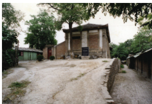
图2 限制型保护时期 丹凤门遗址 ②