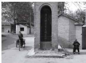
图1 限制型保护时期 含元殿遗址 ①

从实践来看,单纯采取这种“限制型”保护的措施,难以实现遗址保护与城市发展的协调。首先,出于遗址保护的目,大明宫遗址所处道北地区的棚户区遗址未进行城市改造,缺乏基本的排水设施,遗址所处地区一度成为西安低洼棚户区、环境脏乱差的代名词,区域环境也与周边城市环境格格不入,遗址区更被形象的比喻为“城市伤疤”;其次,受保护经费和人员规模的局限,“限制型”保护模式并无法真正实现对于大明宫遗址的有效保护,大明宫地区的遗址除受到雨蚀风化等自然因素影响外,人为取土、搭建违规建筑、修建道路等社会因素对遗址造成的破坏也难以得到及时有效的制止;再次,大明宫遗址区居民生活水平较周边地区而言相对较低,群众缺乏保护遗址的热情,人为破坏遗址的事件层出不穷;最后,由于唐大明宫遗址处于城市中央地带,随着近年来国内房地产市场的持续繁荣,遗址周边地价一路飙升,进一步加剧了遗址保护用地与城市建设用地之间的矛盾。