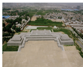
图3 适应性开发时期 含元殿遗址 ③

续对占压在大明宫遗址及其周边的居民、88家企事业单位进行拆迁、安置,进行大明宫国家遗址公园的建设,2010年10月,大明宫国家遗址公园顺利开园,原本贫穷落后的道北棚户区摇身一变,成为了兼具遗址保护、休闲、旅游、教育等多种功能于一体的城市中央公园,在保护文化遗产的前提下,有效地改善了区域环境、增强了城市文化的内涵。