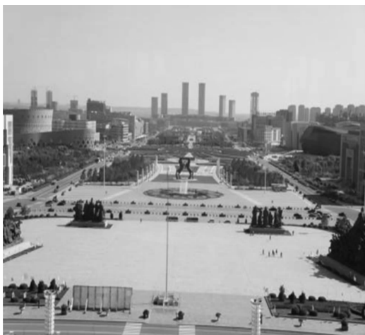
图4 内蒙古鄂尔多斯市康巴什广场