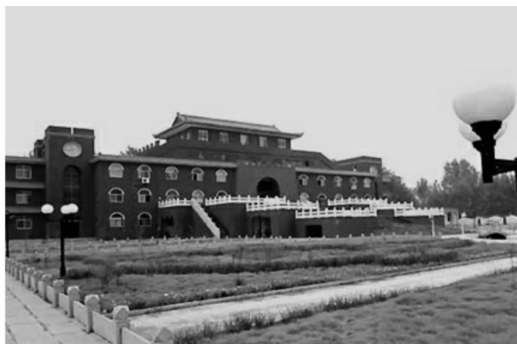
图3 河南夏邑县曹集乡政府

内蒙古鄂尔多斯市康巴什广场（图4）等，都存在因受讲排场、求大气等传统思想左右，出现建成后受人诟病的情形。