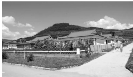
图9 走可持续发展之路的朝鲜族新型传统村落

新型农村合作医疗的普及,村民的健康得到了切实保障。这些举措使白龙村村民的幸福指数逐日上升。另一方面,持续贯彻民俗文化内涵的深层次探究,以朝鲜族传统村落为中心,联系外部大环境以追求更广泛的繁荣前景,通过对朝鲜族传统村落的保护及利用,建设民俗文化弘扬、经济发达、宜居宜游、全面协调和可持续性发展的新型传统村落(图9)。