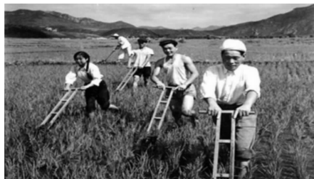
图3 朝鲜族民众的水稻种植场景

民在每逢传统节日来临时，都会穿上洁白素净的民族服饰举行庆祝活动，载歌载舞，热闹非凡。由打糕、八珍菜、冷面、泡菜、大酱汤等菜品组成的丰盛筵席精致考究，尽显独特民俗文化风情。此外，朝鲜族特别注重民族传统礼仪文化的传承，家人一起聚餐时，晚辈须在长辈用餐后方可用餐，向长辈敬酒时须双手推举酒杯，饮酒时，头须稍微偏向身体右侧，并用衣袖遮挡酒杯，这些民族礼仪行为诠释了朝鲜族谦恭端庄、尊卑有序、长幼有序的伦理文化内涵，是朝鲜族人民信仰的见证。朝鲜族人民的居住环境也独具民族特色。传统民居高矮的墙壁与敦厚的屋顶基本接近1:2的比例。而窗与门的比例纤细，线条富于变化，虽与建筑轮廓产生了对立的视觉效果，但却在无形之中打破了建筑本身的笨拙之态，呈现出独特的审美特征 [5] 。屋顶坡度柔和，屋脊形如飞鹤，台阶矮小敦实，整体建筑造型具有舒展之气和均衡稳定之感，白墙灰瓦的建筑外观，体现出朝鲜族“尚白”的色彩哲学和对道家“见素抱朴”哲学思想的艺术表达（图4）。这种独特的建筑艺术风格成为朝鲜族独一无二的民族文化印记，也造就了朝鲜族传统村落别具一格的独特建筑文化内涵，成为朝鲜族人民独有的文化名片。此外，至今广为流传的“长白山达莱”、“阿里郎”等朝鲜族传奇故事融入每一位朝鲜族人民的血脉之中，生生不息，为族人所固守和绵延至今。