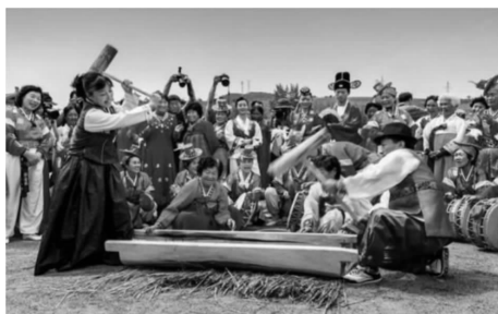
图7 朝鲜族打糕过程演示

深入挖掘朝鲜族传统文化资源的独特魅力,引导游客摒弃走马观花式的旅游方式,让更多的人能够体验朝鲜族原生态的民俗文化风情,进而领悟朝鲜族民族文化的深刻内涵。此外,游客在观赏朝鲜族聚居地区“碧水青山”般自然景观的同时,还能精心品味正宗的朝鲜族传统风味佳肴,也能切身参与到诸如打糕等简单菜品的制作过程当中,并加以悉心地体验与品味(图7)。伴随着宛转悠扬的民族传统音乐,欣赏着能歌善舞的朝鲜族人民带来的民俗舞蹈,并融入其中交流互动。通过精心打造海内外游客流连忘返的朝鲜族民俗风情体验区,不仅能够促进本民族文化的深层贯通传承,极大地增强民族自信心,而且还成为村落居民宣扬本民族优秀传统文化的舞台。在这方面积累成功经验并引领风潮的是有着“朝鲜族农耕文化第一村”美誉的百年部落——图们市月晴镇白龙村,村内的民俗展览馆被誉为中国唯一的朝鲜族历史展馆,馆藏展品万余件,惟妙惟肖地诉说着朝鲜民族的迁移史。另外,丰富多彩的民俗文化遗产也是白龙村得天独厚的文化资源,入选国家级非物质文化遗产的“农乐舞”(图8),通过提高表演队伍的整体素质,借助本村发展民俗旅游的平台形成了领略民俗风情的核心旅游产品,为白龙村民俗旅游业发展发挥了“锦上添花”的积极作用,其显著成效的取得是在国家“乡村振兴战略”和吉林省“金城旅游”政策的引导和推动下完成的,在村民的悉心经营与可持续发展理念的引导下,积极发挥不同保护主体主观能动性,逐步带动了朝鲜族聚居地区的魅力乡村建设。