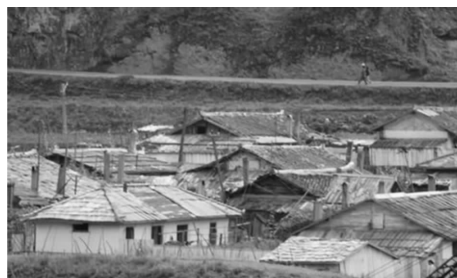
图6 “空壳化”的朝鲜族传统村落

解决这些与人民生活息息相关的问题,传统与现代的冲突将愈演愈烈,终将导致传统村落难以满足对人民现代化生活的适应性与包容性,从而影响到传统村落的可持续发展。