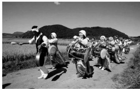
图8 朝鲜族农乐舞表演场景

传统民俗旅游资源的开发作为朝鲜族聚居地新兴产业方兴未艾,较好地调和了传统村落保护与利用之间的生态关系。同时,合理适度地开发朝鲜族传统村落民俗旅游项目,在打破传统农耕经济体制下人民收入来源单一的现状、增加人民收入、提高人民生活水平、改善村落基础设施和延续村落传统风貌等方面发挥了积极作用,在形成一个传统村落保护利用的良性循环机制的同时,又为村落居民子孙后代保存了弥足珍贵的物质和精神财富。