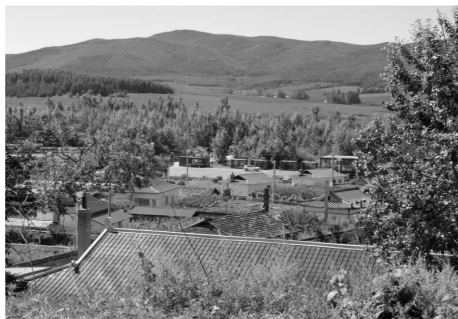
图5 多样化的“新农居”对村落风貌造成破坏

而言,朝鲜族村落居民的文化记忆和情感归属依赖于传统村落空间环境的承载、唤醒和容纳。近年来,一些地方政府由于缺乏对朝鲜族传统村落综合价值的评估与认知,盲目推进新农居建设,大力实施农村泥草房改造工程,以砖混屋身、彩钢屋顶等现代化建筑材料改建或新建起与传统民居外观截然不同的新型民居,虽在短时间内使朝鲜族传统村落居民的居住环境得到了显著改善,但也在一定程度上造成了对村落整体风貌特色的破坏(图5),致使村落居民对村落的文化记忆链条被严重割裂,难以找到曾经的归属感和认同感。朝鲜族文化记忆链的断裂,也就意味着作为一个整体的朝鲜民族自我意识的丧失。这与传统村落保护和发展的“人民性”理念初衷背道而驰,也是传统村落保护利用中最为隐性而深切的问题。