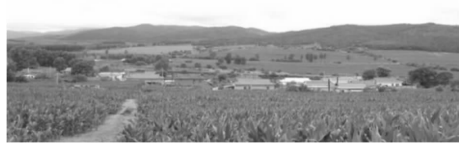
图1 负阴抱阳的朝鲜族传统村落风水格局

农田用地的地势平坦、生产与生活用水的便捷和日常田间管理的方便。村落道路布置随意、参差不齐、阡陌交错、可达性好。整体布局与民居相得益彰,形成舒缓悠然的空间形态,体现了朝鲜族人民趋吉避凶、追求安居乐业的风水观与自然观。