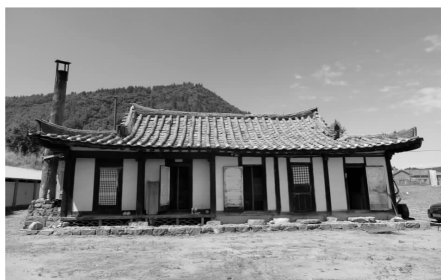
图4 典型的朝鲜族瓦屋顶传统民居

民在每逢传统节日来临时，都会穿上洁白素净的民族服饰举行庆祝活动，载歌载舞，热闹非凡。由打糕、八珍菜、冷面、泡菜、大酱汤等菜品组成的丰盛筵席精致考究，尽显独特民俗文化风情。此外，朝鲜族特别注重民族传统礼仪文化的传承，家人一起聚餐时，晚辈须在长辈用餐后方可用餐，向长辈敬酒时须双手推举酒杯，饮酒时，头须稍微偏向身体右侧，并用衣袖遮挡酒杯，这些民族礼仪行为诠释了朝鲜族谦恭端庄、尊卑有序、长幼有序的伦理文化内涵，是朝鲜族人民信仰的见证。朝鲜族人民的居住环境也独具民族特色。传统民居高矮的墙壁与敦厚的屋顶基本接近1:2的比例。而窗与门的比例纤细，线条富于变化，虽与建筑轮廓产生了对立的视觉效果，但却在无形之中打破了建筑本身的笨拙之态，呈现出独特的审美特征 [5] 。屋顶坡度柔和，屋脊形如飞鹤，台阶矮小敦实，整体建筑造型具有舒展之气和均衡稳定之感，白墙灰瓦的建筑外观，体现出朝鲜族“尚白”的色彩哲学和对道家“见素抱朴”哲学思想的艺术表达（图4）。这种独特的建筑艺术风格成为朝鲜族独一无二的民族文化印记，也造就了朝鲜族传统村落别具一格的独特建筑文化内涵，成为朝鲜族人民独有的文化名片。此外，至今广为流传的“长白山达莱”、“阿里郎”等朝鲜族传奇故事融入每一位朝鲜族人民的血脉之中，生生不息，为族人所固守和绵延至今。