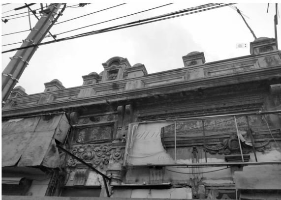
图 13 哈尔滨道外区现存破损的中华巴洛克建筑

近现代以来,由于民众古旧历史建筑保护意识淡漠以及建筑使用功能的频繁更换等各种原因,道外中华巴洛克建筑要么外墙立面材质和颜色被改变,要么内部结构做了变动,整体破损严重(图 13)。