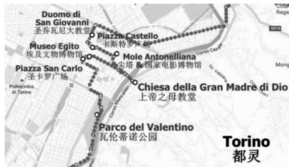
图2 都灵历史中心区古建筑分布