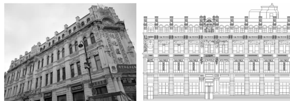
图12 纯化医院外观及外立面

文中选择中华巴洛克建筑的典型代表——位于哈尔滨道外区靖宇街与南头道街交口处的纯化医院(图12),解析其关键艺术特征(表3)。