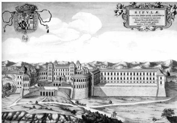
图5 里沃利城堡最初设计

1718年,建筑师菲利普·尤瓦拉开始规划城堡设计,当时的设计目标是成为欧洲最大宅邸之一。尤瓦拉是意大利后巴洛克时代建筑师中的代表人物,其设计风格讲求精准对称,遵循古典法则。尤瓦拉设计方案见图6 [6]1 。可以看出,城堡包括对称的两翼和中央大厅,其中的一翼将建立在原有美术长廊上。这意味着,尤瓦拉的设计中,要拆除原建筑结构中的美术长廊(对比图5)。