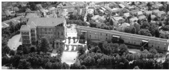
图9 里沃利城堡俯瞰图(修复后)

尤瓦拉原设计中央大厅立面如图10左图 [6]2 。尊重修缮前未建造完成的中央大厅的保存境况,修缮中将其设计定格在工地未完成的状态,以此表达对历史真实性的尊重,并将其设置作为博物馆独有的入口空间。城堡侧面截断的中庭,完全保持其原轮廓,未竣工墙体的顶部覆盖铜板,防止因雨水渗透发生变形。原砖砌墙面上保留已填死的巨型开口的痕迹,显示原建筑中拱廊和拱顶的原有位置。残留下来的厅柱和拱顶不再作为承重构件,而是转变为室外雕塑(图10右图) [6]2 。