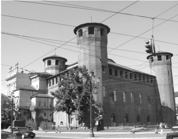
图 3 玛德玛宫的背面和侧面(中世纪风格)

非功利性的态度和客观科学的手段分析历史建筑的建筑价值、艺术价值、人文价值等,注重古旧建筑历史文化要素传承的原真性;保留所有历史场合具备历史信息及价值或艺术特色的要素,最大程度地展示建筑遗产的历史真实性,修旧如旧;如果作品本身被扰乱、被重画所覆盖、被拙劣的修复所破坏,其漆面氧化、污染或缺失等,则需要重建作品的美学质量,以新补旧。