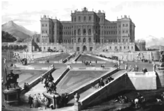
图6 菲利普·尤瓦拉设计的里沃利城堡

1718年,建筑师菲利普·尤瓦拉开始规划城堡设计,当时的设计目标是成为欧洲最大宅邸之一。尤瓦拉是意大利后巴洛克时代建筑师中的代表人物,其设计风格讲求精准对称,遵循古典法则。尤瓦拉设计方案见图6 [6]1 。可以看出,城堡包括对称的两翼和中央大厅,其中的一翼将建立在原有美术长廊上。这意味着,尤瓦拉的设计中,要拆除原建筑结构中的美术长廊(对比图5)。