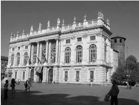
图 4 玛德玛宫的正面(巴洛克风格)

(3)里沃利城堡。里沃利城堡当代艺术博物馆是意大利古旧历史建筑修复改造的典范,庞大恢弘的里沃利城堡位于都灵市郊,位于苏萨谷入口的重要位置,是意大利萨沃伊王室的府邸建筑。