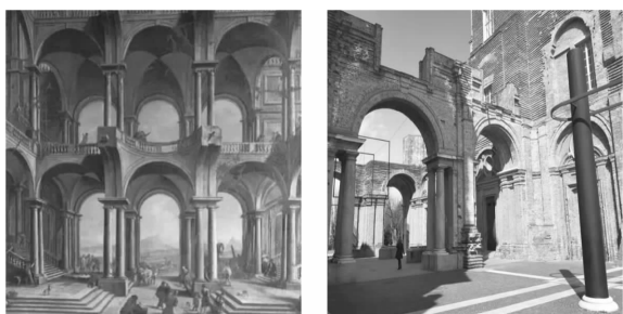
图10 尤瓦拉设计的中央大厅和修复后的厅柱和拱顶

尤瓦拉原设计中央大厅立面如图10左图 [6]2 。尊重修缮前未建造完成的中央大厅的保存境况,修缮中将其设计定格在工地未完成的状态,以此表达对历史真实性的尊重,并将其设置作为博物馆独有的入口空间。城堡侧面截断的中庭,完全保持其原轮廓,未竣工墙体的顶部覆盖铜板,防止因雨水渗透发生变形。原砖砌墙面上保留已填死的巨型开口的痕迹,显示原建筑中拱廊和拱顶的原有位置。残留下来的厅柱和拱顶不再作为承重构件,而是转变为室外雕塑(图10右图) [6]2 。