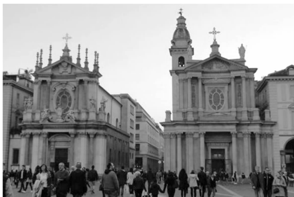
图1 圣卡洛教堂和圣克里斯蒂纳教堂

圣卡洛广场是都灵市中心最大的广场,号称“都灵的客厅”。广场四周分布着许多美不胜收的巴洛克建筑,这些建筑装饰精美,外墙浮雕装饰形态各异,几乎没有重复。广场中央矗立着著名的雕像“铜马”(城市象征)。广场的南端是两座巴洛克风格的教堂:圣卡洛教堂和圣克里斯蒂纳教堂(图1) [4] 。这两座比肩而立的教堂,对称地坐落在罗马街的两侧,均建于17世纪,巴洛克式的动感及繁细精致的内外部装饰亦令人感到目不暇接(表1)。