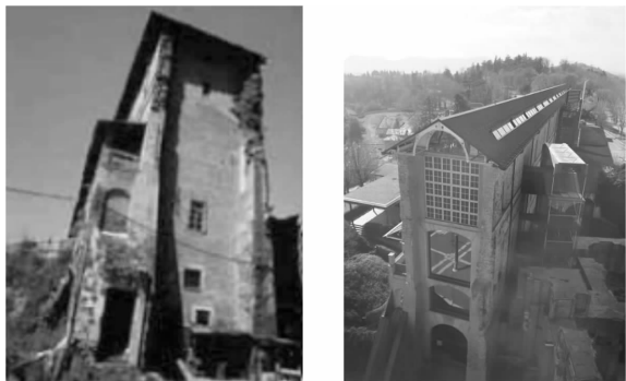
图11 长廊修复前后(左为修复前,右为修复后)

都灵巴洛克历史建筑的传承修复及更新方式,既不消极又不折衷,基于对建筑现状及功能的慎重考量,通过建筑语言交待建筑的历史变迁,在保存重要的历史信息 and 艺术价值的同时,又使其形式不至于陈腐,这对于国内建筑设计是一种启示。