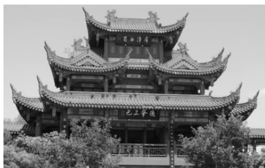
图3 北方村落建筑配色