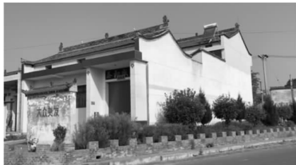
图1 关中地区乡村建筑现状

中国古老的建筑和园林景观是非常珍贵的“活化石”,是我国悠久的历史文化之中非常重要的一个部分,然而现在关中地区的很多乡村建筑却没有历史的踪影(图1)。乡村振兴建设的最终目的是既让乡村居民的生活条件得到改善、生活质量和工作收入得以提高,还要让群众在精神层面得到美的享受、养成美的德行,让乡村居民真正热爱他们自己的生活环境,不再盲目地追求城市所谓的“现代化”。这就需要我们在建设的过程中将关中传统文化元素有效融入到乡村振兴建设的每一个方面,让优秀传统文化元素时时刻刻影响着群众的回忆和情操,把“天人合一”的理念合理地运用在乡村振兴建设之中,让乡村既能体现出城市般现代化的功能性又有充满着乡村诗意和传统文化的味道,打造留得住的乡愁和留得住的乡村振兴,这才是乡村振兴建设的最终目的。