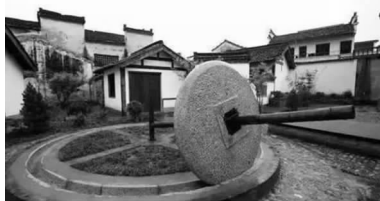
图4 传统的农具主题小品

实用价值转变为艺术价值,体现其观赏功能。既装点了村庄,也是一种乡村优秀传统文化的展示(图5)。在乡村景观的设计中也可以把当地的历史名人或名人故事建造为雕塑小品展现在村庄之中,例如在我国陕西省宝鸡市扶风县马家村南沟边出土的师旷墓,它的主人是中国古代十大音乐家,晋国著名盲人乐师师旷,他被尊称为“乐圣”。在先秦文献中,常以师旷代表音感特别敏锐的人,传说师旷鼓琴,通乎神明。马家村就可以建造一个师旷雕塑,既缅怀了先人也传承了历史,更改善和提升了乡村的人居文化环境(图6)。