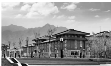
图2 西安建筑科技大学草堂校区秦汉建筑风格

市大荔县平罗村把本土传统文化元素之中的“陕西十大怪”以及“忠孝礼仪”融入到了墙面装饰当中。也可以在建造过程中充分调研,了解关中居民人文情况和生活习惯,运用关中地区独特的建筑材料来建造房屋,例如利用木质、竹质、土壤、山水条件等等 [7] 。在建筑装饰的色彩选择上多做文章,选择适合当地民俗民风的色调。例如黑白灰的颜色给人一种清新、通透的感觉,是南方村庄建筑中常出现的配色,而红色、褐色的配色是北方村庄建筑常用到的,配有砖石,给人厚重、朴实的感觉(图3)。