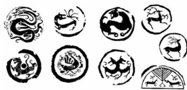
图9 秦汉时期的瓦当纹样

上的镂空纹样、秦汉时期传统建筑檐部形式、飞檐上雕刻的辟邪祈福的灵兽、古建筑中的斗拱结构等。在花纹的选择上可以选择汉代纹饰的图案,例如秦汉时期瓦当纹样(图9),三爪四足的龙样等等。在垃圾桶的设计中,落实做到垃圾分类。一个好的公共设施,不仅可以有效地提高使用频率,还可以增强村民爱护公共设施的意识,增强村民对农村的“归属感”,让村民能够达到“身临其境”的感觉,设计者要根据农村所处的文化背景,地域环境,农村规模等因素的差异,提出不同的设计方案,使其更好地与环境相融合(图10) [10] 。