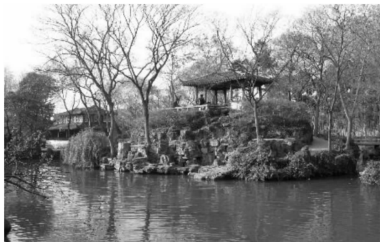
图4 拙政园山水

于事理而周流无滞,有似于水,故乐水;仁者安于义理而厚重不迁,有似于山,故乐山。”由此可见,山和水在儒学眼中具有优良的品格,按现在的观点,这是一种审美移情,在这样的思想指导下,中国古典园林奠定了宏大的山水审美观,几乎无园不山,无园不水。北方皇家园林,以其绝对的实力,包罗原山真湖,或者大规模挖湖堆山,北京西郊三山五园,含香山、玉泉山、万寿山、昆明湖等。而江南,大如拙政园(图4),水面占了全园面积一半以上,刻意营造东海的浩渺广阔,堆筑蓬莱、方丈、瀛洲三座海中仙山,集中体现了儒家山水审美主张;再如网师园,也是一个以水为主景的园林,其他景致围绕水面展开,表达渔隐的愿望;狮子林、环秀山庄等则以叠山著称,山形险峻,山路岖曲;个园的四季假山更是写意假山中的一绝;至于寄畅园更是巧妙利用了二泉的水,形成各种水的形态,同时利用惠山的龙气,堆叠案墩假山,蜿蜒入园,成为余脉。而对于山水的审美,《中庸》这部儒学经典中进一步提出“卷石勺水”的概念,从根本上改变了园林自然美的审美方式,使中国古典园林摆脱了对自然山水原型的简单模拟和照搬,通过艺术的高度概括来再现自然山水之美,唐宋之后,繁荣发展的江南私家园林开始寻求中隐的精神避所,“一峰则太华千寻,一勺则江湖万里”,寄畅园的八音涧,引二泉之水,穿流于假山之间,有自然之态,又不拘自然之俗,水流潺潺,犹如八种乐器和鸣,遐思不已。