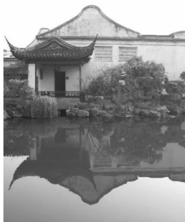
图7 网师园的意境感悟

悟世界。《诗经》提出诗歌六义,风雅颂,赋比兴。以物喻物谓之比,借物起兴谓之兴 ⑨ 。孔子最先引出诗性思维模式,“诗言志”“兴于诗”,简单地理解就是要论述一件事,先用另一件事引入,这就是比兴,让受众通过一个熟悉的事物获得一个基本认知,有助于理解。江南古典园林中通过比兴的方式,让看似无关的事物建立某种联系,完成诗画意境,通过静虚来感悟诗画意境,从而达到情与景的交融。一花一木,一山一石,无不关情(图7),网师园,以渔隐的方式,有限空间内通过水面静虚来感悟诗画意境,从而达到情与景的交融,闲庭信步,面对一池碧水,感叹人间繁华;拙政园与谁同坐轩,与谁同坐,明月清风与我,寂寥间,于蕉窗听雨,慨叹残荷落日,得意时,于鸢厅赏菊,喜吟梧桐栖凤;狮子林,更是儒学和禅宗思想相碰撞的佳作,感悟程门立雪,再现一苇渡江。