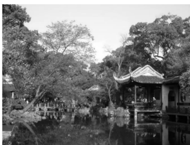
图6 寄畅园中和之美(作者自摄)

美” [8]28-45 。这种中和之美,也必然包括精神伦理道德的向善追求。《国语·楚语上》评价,“夫美也者,上下、内外、大小、远近皆无害焉,故曰美”。所有关注形式美原则的艺术,包括园林艺术,离不开中和之美的本质,要求协调各对立因素以达到多样统一的和谐。在此思想引导下的中国古典园林在造园艺术上,极为讲究,处处体现以和为美。将各种对立因素和谐统一起来,追求含蓄之美,这形成了中国园林的内在神韵。园林布局虚实相间,疏密得当;园林尺度,精而体宜,避免夸张之势;园林建筑,讲究主从得当,各司其职;园林植物,俯仰得当,聚散得体,相配合宜。正是由于这种思想,中国园林从来都没有尺度巨大的建筑,即使北方皇家园林,如颐和园,最大体量的佛香阁,也是借山势和台基才形成了全园的主景。再看江南寄畅园,围绕锦汇漪,以嘉树堂为主景,先月榭与之遥相呼应,又有知鱼槛与鹤步滩相对,同时郁盘亭廊、七星桥、涵碧亭及清御廊等绕水而构,与假山相映成趣(图6)。江南园林寄畅园,围绕锦汇漪,协调各因素以达到多样统一的和谐,体现中和之美。而江南较大的园林,如拙政园,虽然园景被分割成东中西三部分,亦以水面相联系,步移景异,协调共生,同在中国园的几处大型景点,如远香堂、玉兰堂、香洲、听雨轩等,假借地形,互相呼应,彼此成就。