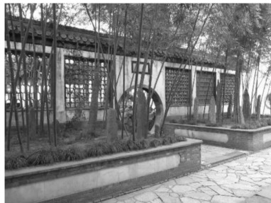
图5 个园竹景

如斯夫,不舍昼夜” [6]327 。山水,在园林中的地位不限于山水,是一种道的象征,无锡寄畅园,取自王羲之《答许椽》诗“取欢仁智乐,寄畅山水阴”之意,表达寄情山水的畅快,锦汇漪旁的知鱼槛向世人讲述了庄子和惠子游于濠梁之上,感悟人生,提出的“子非鱼,焉知鱼之乐”故事,告诉人们不要枉自揣度他人;《孟子·离娄上》记载,“沧浪之水清兮,可以濯我缨,沧浪之水浊兮,可以濯我足”,乃“自取之乐”也,传达了一种不与世俗同流合污的洁身自好,沧浪亭即取名于此。拙政园小沧浪、网师园濯缨水阁都反映了这种善恶清浊之道。而在比德中,美是道德的象征,自然景物是道德、品格的象征和符号。园林中的一切要素景致,无不关乎君子品德心性,是其外在表现。在此影响下,江南古典园林在园林植物的选择上尤其呈现一种普遍的君子比德的审美取向。竹子,因其虚心而有节,几乎无园不竹。更有甚者,个园(图5)的个字就是对竹叶的模拟。个园以竹命名,体现了“君子比德”思想的典型特征,表现了园主以竹之“虚心有节”为准则的精神,反映了园主对于竹的热爱;荷花,出淤泥而不染;松竹梅,岁寒三友;梅兰竹菊,花中四君子;岁寒,然后知松柏之后凋也。均出于君子比德的审美目的,影响了植物景观的呈现面貌。不仅植物,在其他造园要素的选择与营建上,亦体现这一特征。例如园林铺装图案的选择,体现君子情怀和谐音借喻文化;建园石材的选取,取太湖石的玲珑剔透,黄石的遒劲质朴之意,等等。