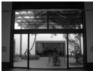
图9 苏博庭园

最重要的一点,意境深远,是中国园林的精华所在,我们的修复和重建工作必须以此为准则,把