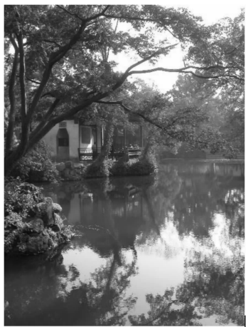
图2 寄畅园中国文人园的翘楚(作者自摄)

汉代董仲舒建立了新儒学体系,并为汉武帝所采纳,从此儒学成为中国统治阶层的正统思想。但儒学并未固步自封,晋以后儒释道的分合消长,代替了长期以来的独尊儒术,儒学与释、道构成一种平衡关系。宋明理学开始,儒学自身就融合了释道的思想成为一个矛盾复杂体。其他思想,尤其禅宗,被文人士大夫所接受并深刻渗透到他们的文化心理和艺术精神中 [3] 。作为中国长期以来的统治思想,其对中国园林地影响是不容忽视的。从某种意义上而言,儒学奠定了中国古典园林的思想基础,形成了源远流长的园林文化,如始建于明代的无锡寄畅园(图2),即是一例典型案例。