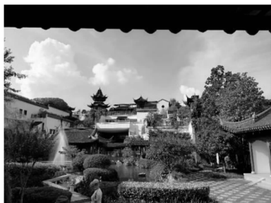
图8 江宁织造府庭园

山水是比道的载体,在此基础上的山水布局与建构都体现特定的审美理想。古典园林的修复要重视山水关系,讲究山水俯仰相合,讲究山形山势的得当,以奠定园林格局。但并非倡导现代的仿古园林每一个都挖湖堆山,许多作品都做出了较为成功的探索,例如吴良镛院士设计的南京江宁织造博物馆(图8),以建筑和山石搭配,形成核桃模式的山水关系,成为设计的经典;再如苏州贝聿铭先生设计的苏州博物馆,开阔的水面,白墙前的片石山景,把握了山不在高水不在深的精髓。